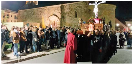
Processó el Silenci