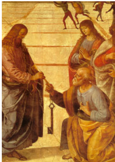
Crist lliurant les claus a Pere. Pintura del Perugino, Capella Sixtina (Ciutat del Vaticà)

En aquel tiempo, Jesús y sus discípulos se dirigieron a las aldeas de Cesarea de Felipe; por el camino, preguntó a sus discípulos: «¿Quién dice la gente que soy yo?» Ellos le contestaron: «Unos, Juan Bautista; otros, Elías; y otros, uno de los profetas». Él les preguntó: «Y vosotros, ¿quién decís que soy?» Pedro le contestó: «Tú eres el Mesías». Él les prohibió terminantemente decirselo a nadie. Y empezó a instruirlos: «El Hijo del hombre tiene que padecer mucho, tiene que ser condenado por los ancianos, sumos sacerdotes y escribas, ser ejecutado y resucitar a los tres días». Se lo explicaba con toda claridad. Entonces Pedro se lo llevó aparte y se puso a increparlo. Jesús se volvió y, de cara a los discípulos, increpó a Pedro: «¡Quítate de mi vista, Satanás! ¡Tú piensas como los hombres, no como Dios!» Después llamó a la gente y a sus discípulos, y les dijo: «El que quiera venir conmigo, que se niegue a sí mismo, que cargue con su cruz y me siga. Mirad, el que quiera salvar su vida la perderá; pero el que pierda su vida por mí y por el Evangelio la salvará.»