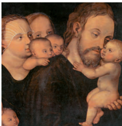
Jesús i els infants. Fragment de la pintura de Lucas Cranach, el Vell. Museu Winterthur (Zúric)

El que escandalice a uno de estos pequeñuelos que creen, más le valdría que le encajasen en el cuello una piedra de molino y lo echasen al mar. Si tu mano te hace caer, córtatela: más te vale entrar manco en la vida, que ir con las dos manos al infierno, al fuego que no se apaga. Y, si tu pie te hace caer, córtatelo: más te vale entrar cojo en la vida, que ser echado con los dos pies al infierno. Y, si tu ojo te hace caer, sácatelo: más te vale entrar tuerto en el reino de Dios, que ser echado con los dos ojos al infierno, donde el gusano no muere y el fuego no se apaga.»