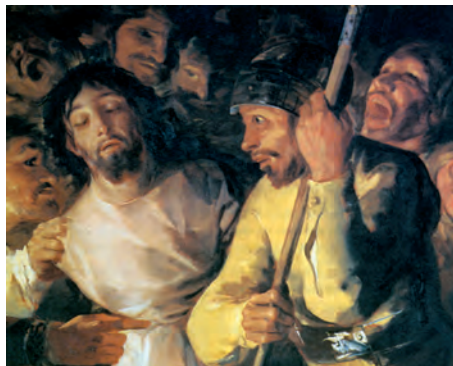
Prendimiento (Jesús detingut a Getsemani). Pintura de Goya (detall), Catedral de Toledo

Tenim posada l'esperança en el Senyor, / auxili nostre i escut que ens protegeix. / Que el vostre amor, Senyor, no ens deixi mai; / aquesta és l'esperança que posem en vós. R.