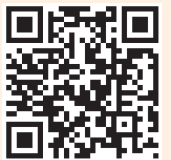
Accés al Breviari