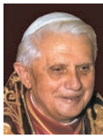
Una pregària trinitària