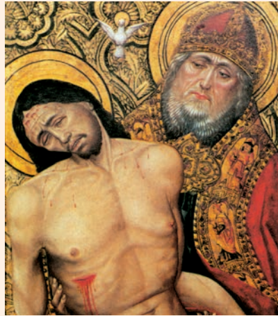
La Santíssima Trinitat. Pintura de l'anomenat Mestre de Villсандino. Parròquia de la Nativitat de Maria, Villсандino (Burgos)

Todo lo sometiste bajo sus pies: / rebaños de ovejas y toros, / y hasta las bestias del campo, / las aves del cielo, los peces del mar, / que trazan sendas por el mar. R.