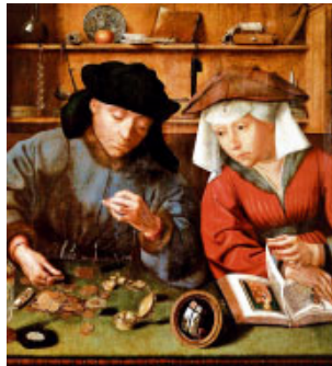
El culte al diner: El banquer i la seva esposa , de Quentin Matsys (1466-1530). Museu del Louvre (París)

Por la mañana sácianos de tu misericordia, / y toda nuestra vida será alegría y júbilo. / Baje a nosotros la bondad del Señor / y haga prosperar las obras de nuestras manos. R.