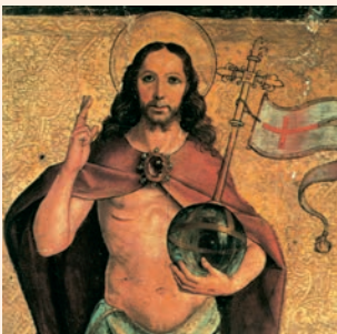
El Salvador. Pintura sobre taula, atribuïda a Pedro Berruguete. Museu Diocesà de Palència

»¿O qué rey, si va a dar la batalla a otro rey, no se sienta primero a deliberar si con diez mil hombres podrá salir al paso del que le ataca con veinte mil? Y si no, cuando el otro está todavía lejos, envía legados para pedir condiciones de paz. Lo mismo vosotros: el que no renuncia a todos sus bienes no puede ser discípulo mío.»