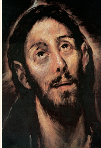
El Salvador. Pintura d'El Greco (fragment), Ciutat del Vaticà

Jesús les dijo: «Os aseguro que los publicanos y las prostitutas os llevan la delantera en el camino del reino de Dios. Porque vino Juan a vosotros enseñándoos el camino de la justicia, y no le creísteis; en cambio, los publicanos y prostitutas le creyeron. Y, aun después de ver esto, vosotros no recapacitasteis ni le creísteis.»