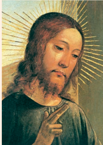
Faç de Crist. Fragment del Tríptic de la Santa Cena, Sagristia de la Catedral de Toledo

En aquel tiempo, llamó Jesús a los Doce y los fue enviando de dos en dos, dándoles autoridad sobre los espíritus inmundos. Les encargó que llevaran para el camino un bastón y nada más, pero ni pan, ni alforja, ni dinero suelto en la faja; que llevaran sandalias, pero no una túnica de repuesto. Y añadió: «Quedaos en la casa donde entréis, hasta que os vayáis de aquel sitio. Y si un lugar no os recibe ni os escucha, al marcharos sacudíos el polvo de los pies, para probar su culpa.» Ellos salieron a predicar la conversión, echaban muchos demonios, ungián con aceite a muchos enfermos y los curaban.