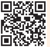
Accés al Breviari

13. ■ Dilluns (litúrgia hores: 3a setm.) [Ex 1,8-14.22 / Sl 123 / Mt 10,34-11,1]. Sant Enric (†1024), emperador germànic; sant Eusebi de Cartago, bisbe; santa Teresa de Jesús dels Andes, vg. carmelitana xilena; santa Sara, vg.