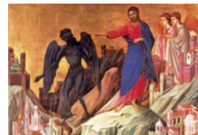
Temptació a la muntanya de Duccio di Buoninsegna (1308-1315)

Entendre bé Gn 1-11 reclama superar el llenguatge literal per copsar-ne el seu missatge teològic. L'antropomòrfic 2n relat de la creació ( Gn 2,4s ) planteja més l'origen del mal que el del món.