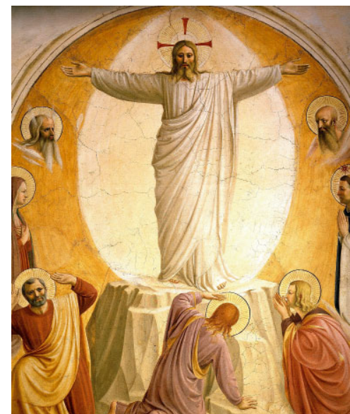
Transfiguració de Fra Angelico (1440-1442), Basilica de Sant Marc, Florència (Itàlia)

E l Senyor digué a Abram: «Vés-te'n del teu país i de la casa del teu pare, cap al país que t'indicaré». No sabem l'anterior trajectòria espiritual d'Abram però Abram se n'anà com el Senyor li digué.