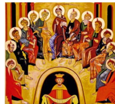
Corona Misterica, Pentecosta (2004), de Kiko Argüello. Catedral de l'Almudena de Madrid

Elis jueus a Pentecosta donaven gràcies a Déu: primer pel do de la collita i des del s. II aC pel gran do de l'Aliança.