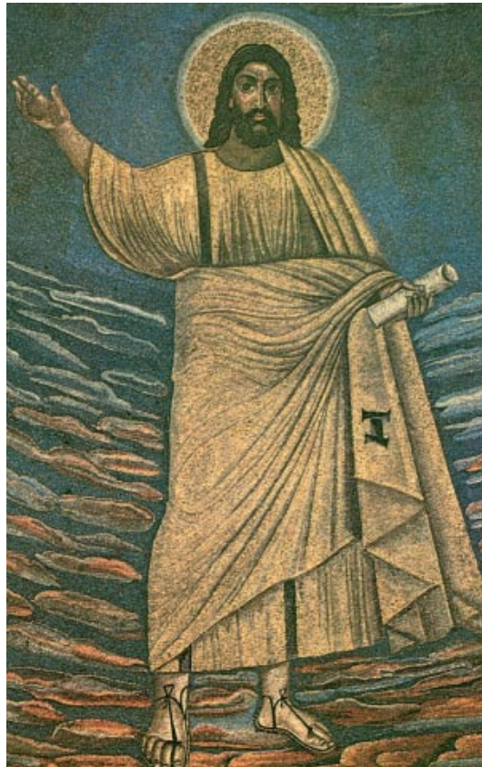
Jesucrist com a mestre universal. Mosaic de l'absis de la basílica de Sant Cosme i Sant Damià, Roma

«¿Es que pueden ayunar los amigos del novio, mientras el novio está con ellos? Mientras tienen al novio con ellos, no pueden ayunar. Llegará un día en que se lleven al novio; aquel día sí que ayunarán. Nadie le echa un remiendo de paño sin remojar a un manto pasado; porque la pieza tira del manto, lo nuevo de lo viejo, y deja un roto peor. Nadie echa vino nuevo en odres viejos; porque revientan los odres, y se pierden el vino y los odres; a vino nuevo, odres nuevos.»